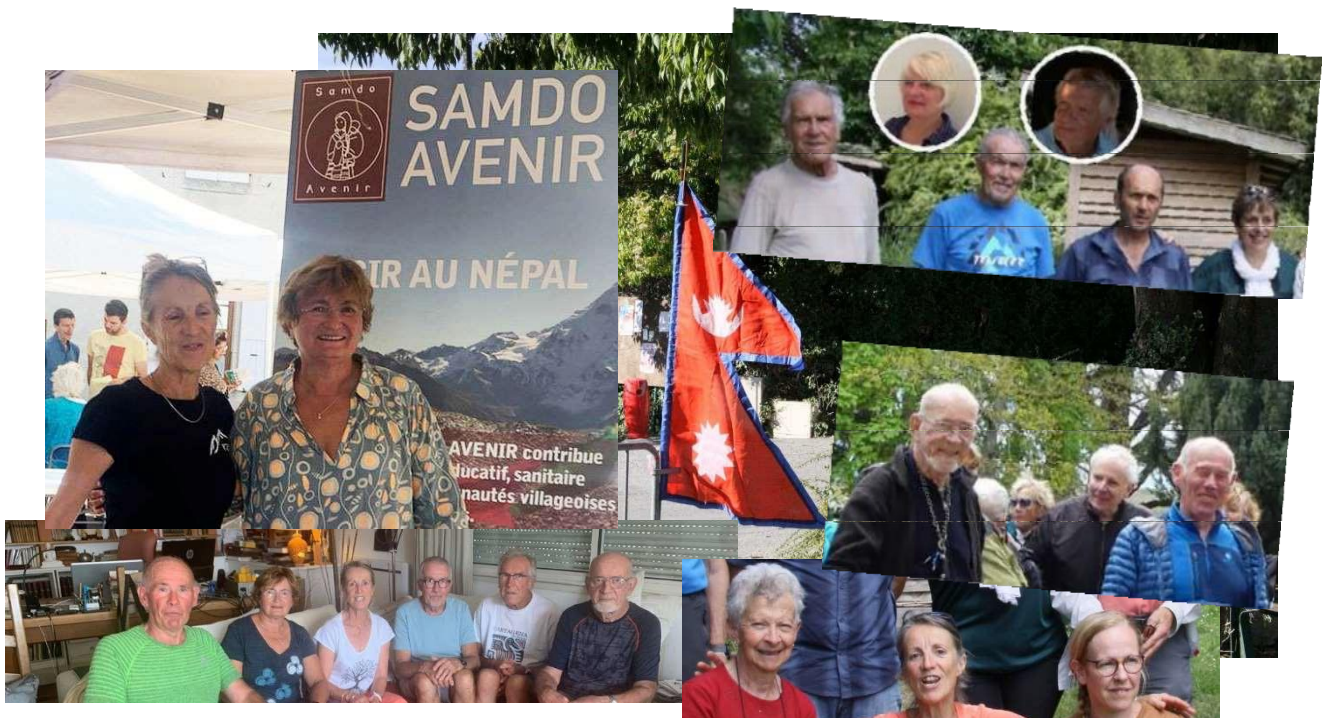
L'équipe Samdo Avenir

Son objectif : « contribuer au développement éducatif, sanitaire et économique de communautés villageoises népalaises, au travers d'actions menées à leur profit et relayées par convention avec une organisation non gouvernementale népalaise (Samdo Bavishya) ».