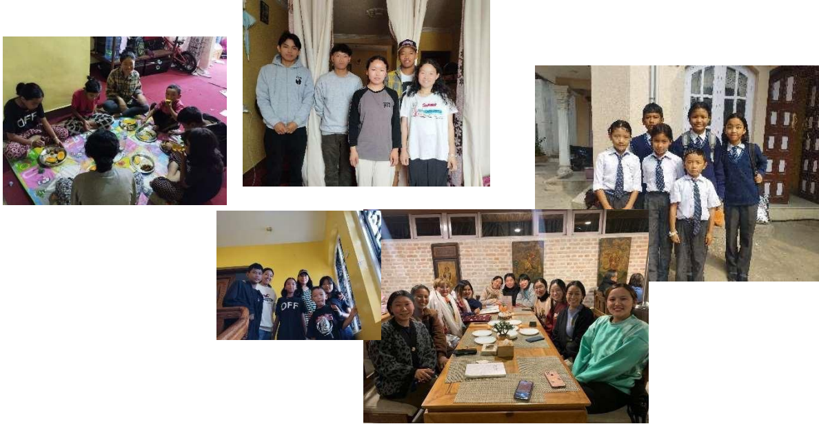
Les enfants de Namgyal & les anciens élèves

En 2025, 9 élèves sont à la Namgyal School ou dans d'autres écoles, choisies en fonction des spécialités offertes. Ils maîtrisent le népalais et le tibétain et savent communiquer en anglais.