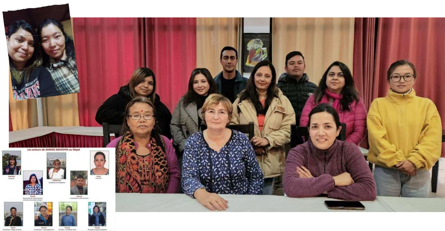
L'équipe Samdo Bavishya