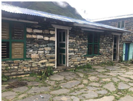
école de Samdo après reconstruction

En 2022, Samdo Avenir a financé la reconstruction partielle de l'école de Samdo, affaiblie à la suite du séisme de 2015 et des hivers rigoureux qui ont suivi. Elle a été rebâtie en ré-utilisant les pierres et en modifiant la conception (ajout d'un chaînage) pour une meilleure tenue parasismique.