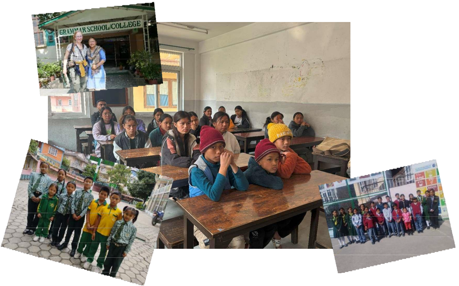
Katmandou, Grammar school